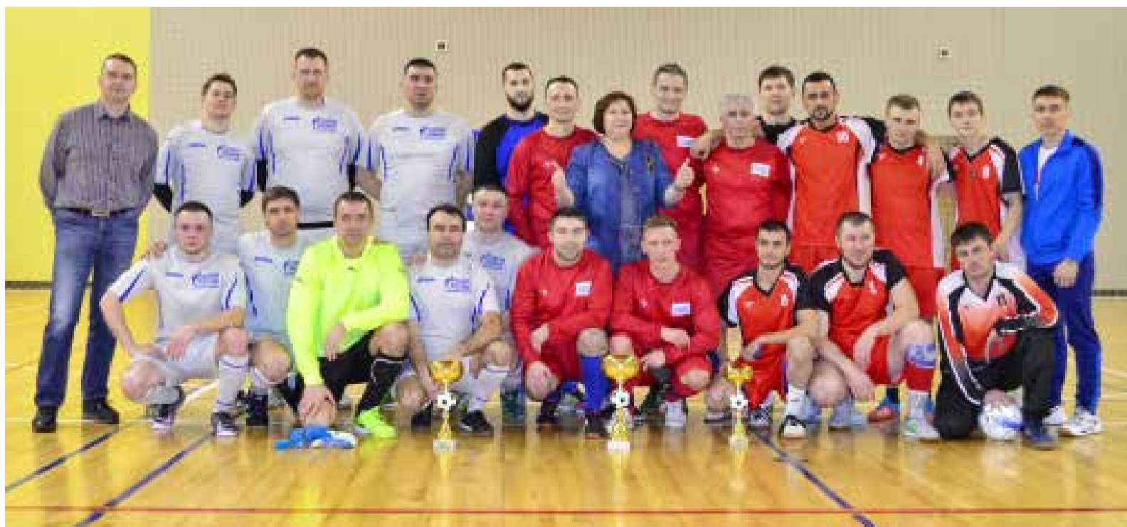
Команды Уренгойского и Надымского филиалов ООО «Газпром энерго» и АО «Управляющая коммунальная компания»