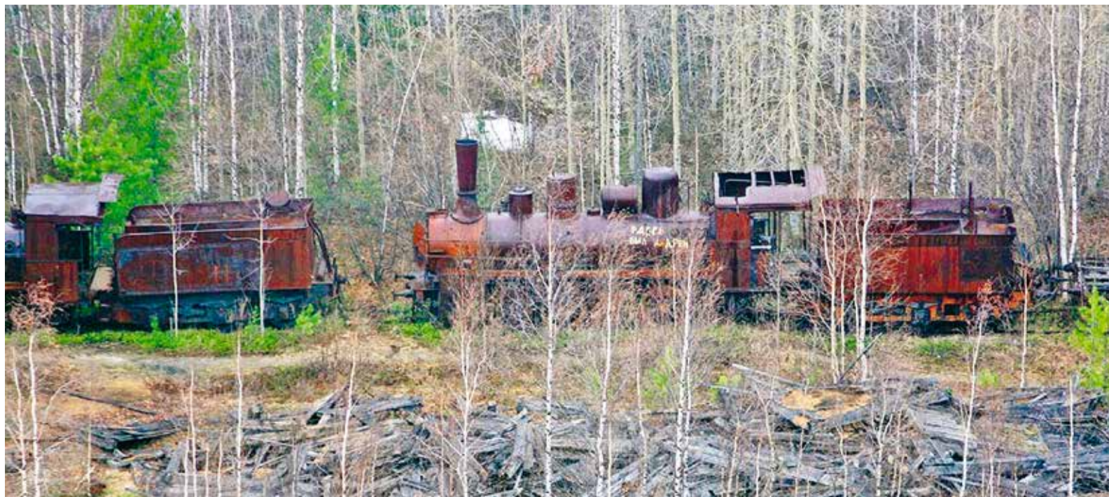
Всё необходимое для строительства, от кирпича и гвоздя до паровоза, завозилось с материка. Так же были завезены рельсы, вагоны, дрезины, которые до сих пор стоят в тундре