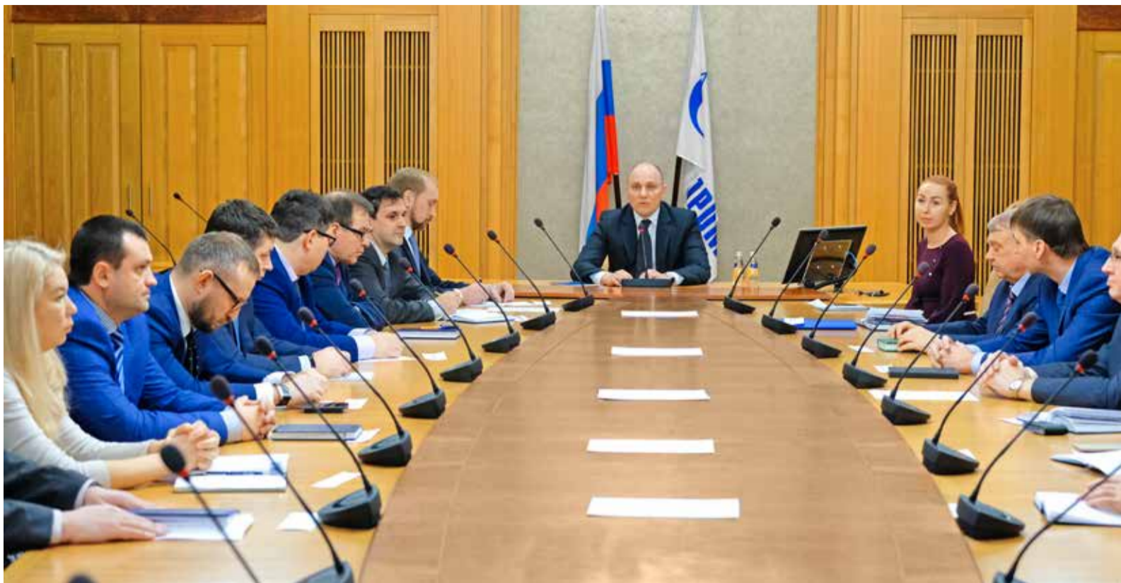
Во время совещания с руководителями структурных подразделений

— Нелишне будет напомнить, что в апреле 2017 года Общество защитило на Правлении ПАО «Газпром» Комплексную целевую программу реконструкции и технического перево-