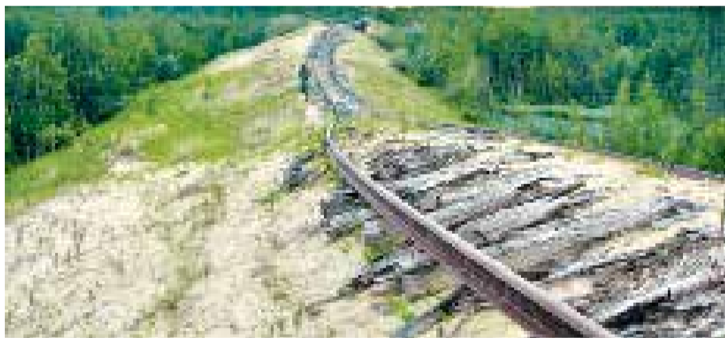
Трансполярная магистраль сегодня. Перегон Салехард — Надым