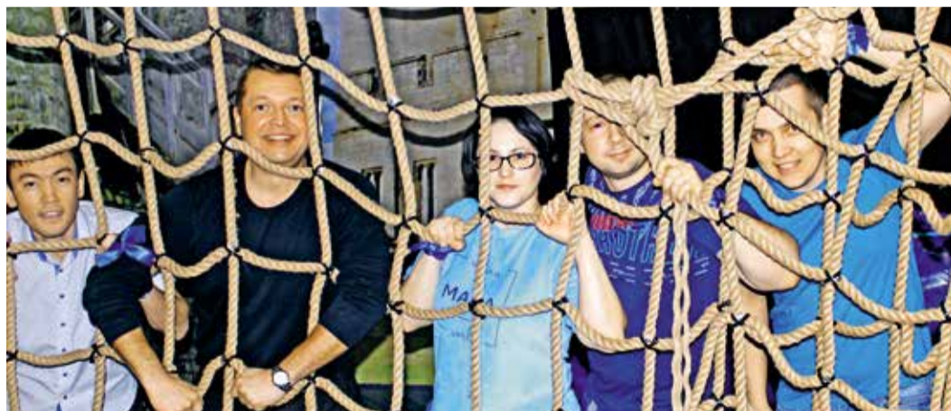
Верёвочная паутина не стала преградой на пути отважных рыцарей