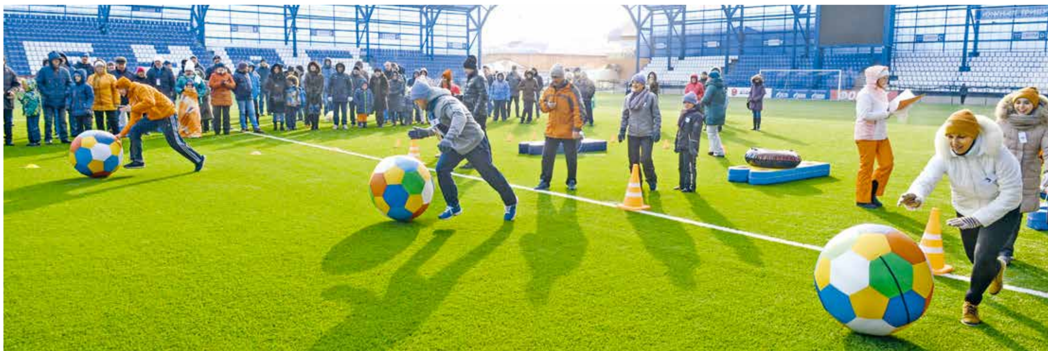
«Ведение мяча» — один из конкурсов состязаний «Папа, мама, я — спортивная семья»