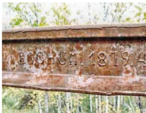
В послевоенные годы рельсов в СССР не хватало. Завозились рельсы, снятые с действующих направлений. На рельсах и костылях дороги самые различные даты выпуска — начиная с 1879 года