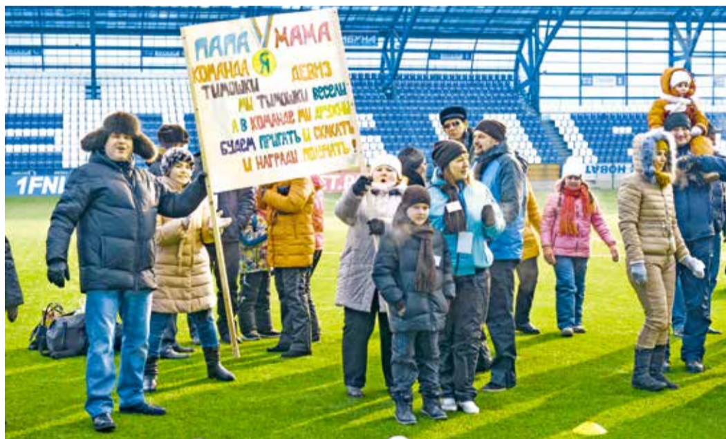
Двадцатипятиградусный мороз не убавил активности болельщиков