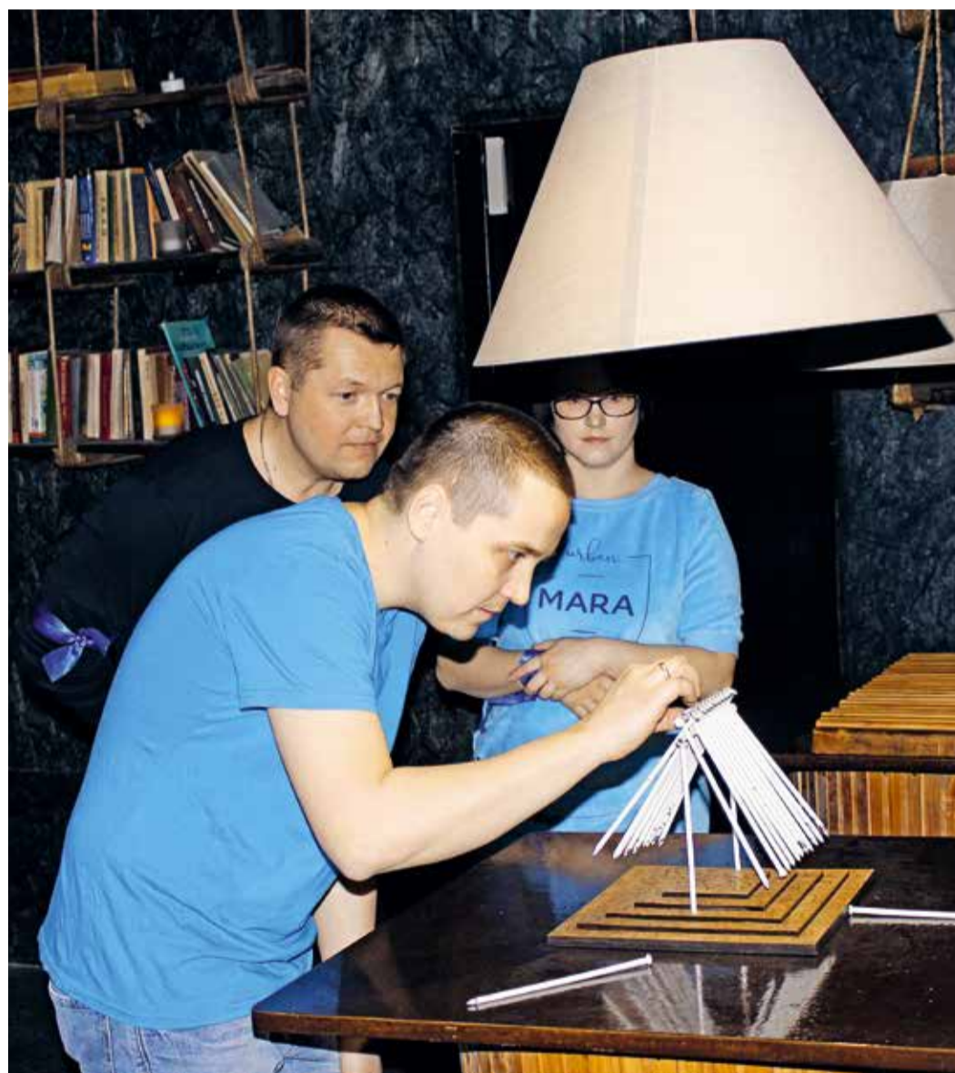
Одно из испытаний: игрок и ведущий вытаскивают по одному гвоздю по очереди, проигрывает тот, на ком распалась конструкция