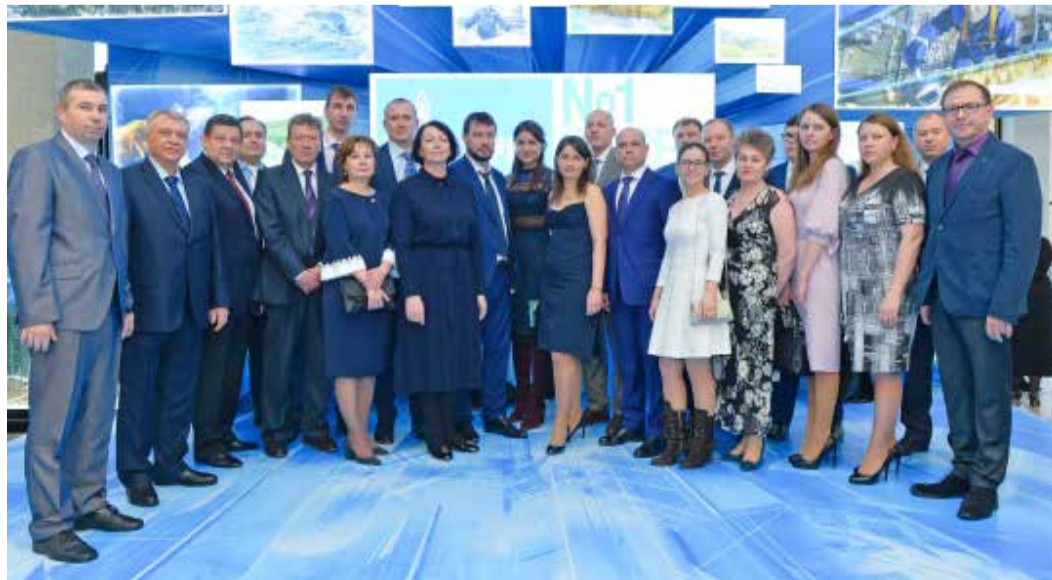
Представители делегации ООО «Газпром энерго» на праздничных мероприятиях в Кремле

Председатель Правления ПАО «Газпром» А.Б. Миллер