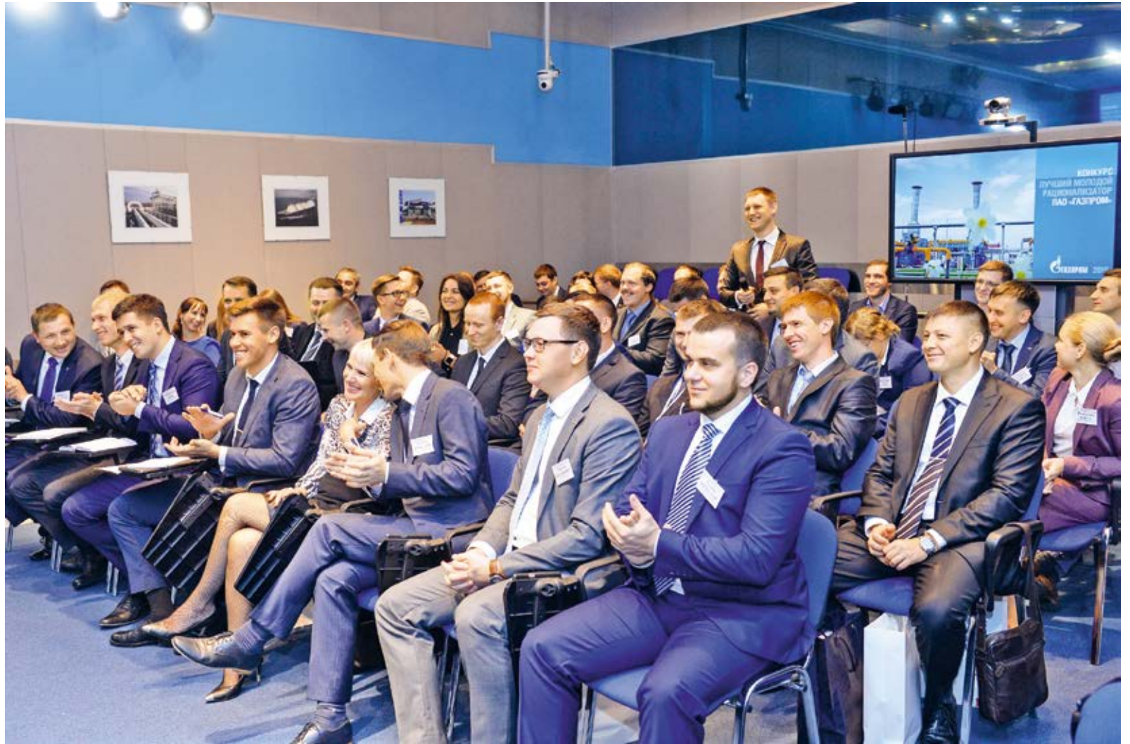
Во время совещания

Позиционируя молодёжь «Газпрома» как проводника самых современных тенденций в области молодёжной политики государства, в рамках семинара-совещания была организована сдача норм ГТО. Перед де-