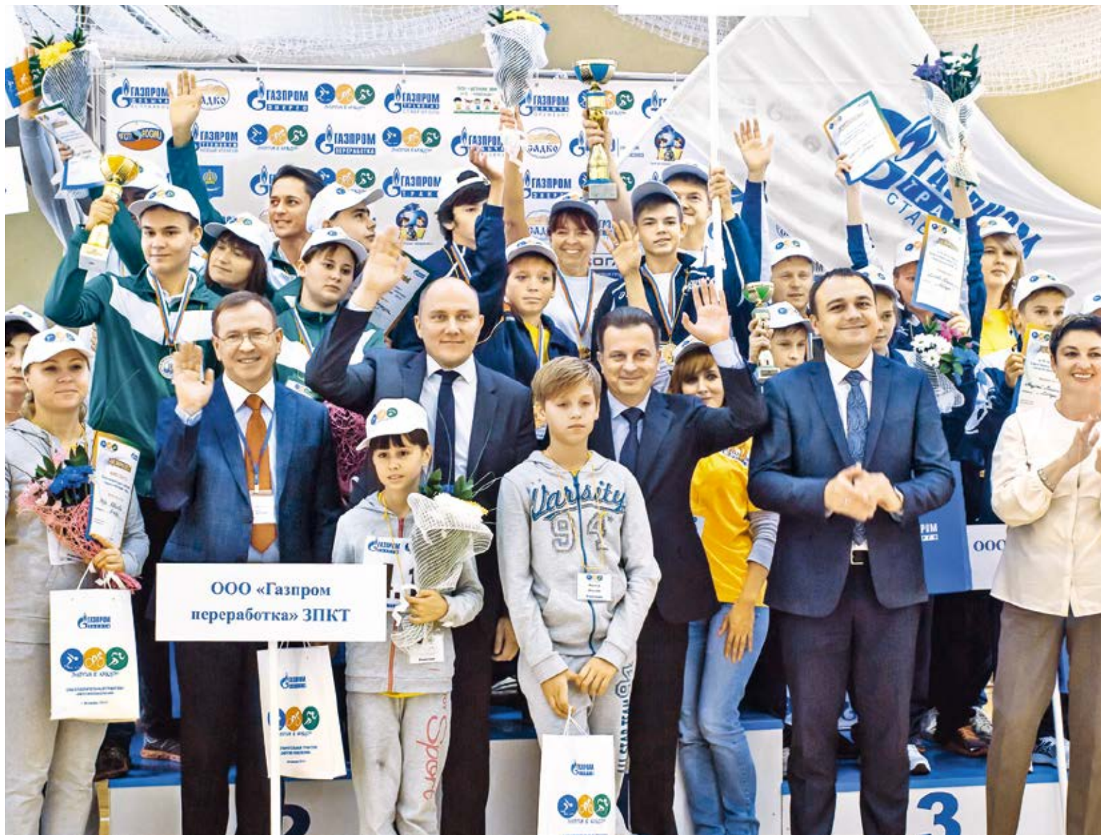
Вместе дружная семья