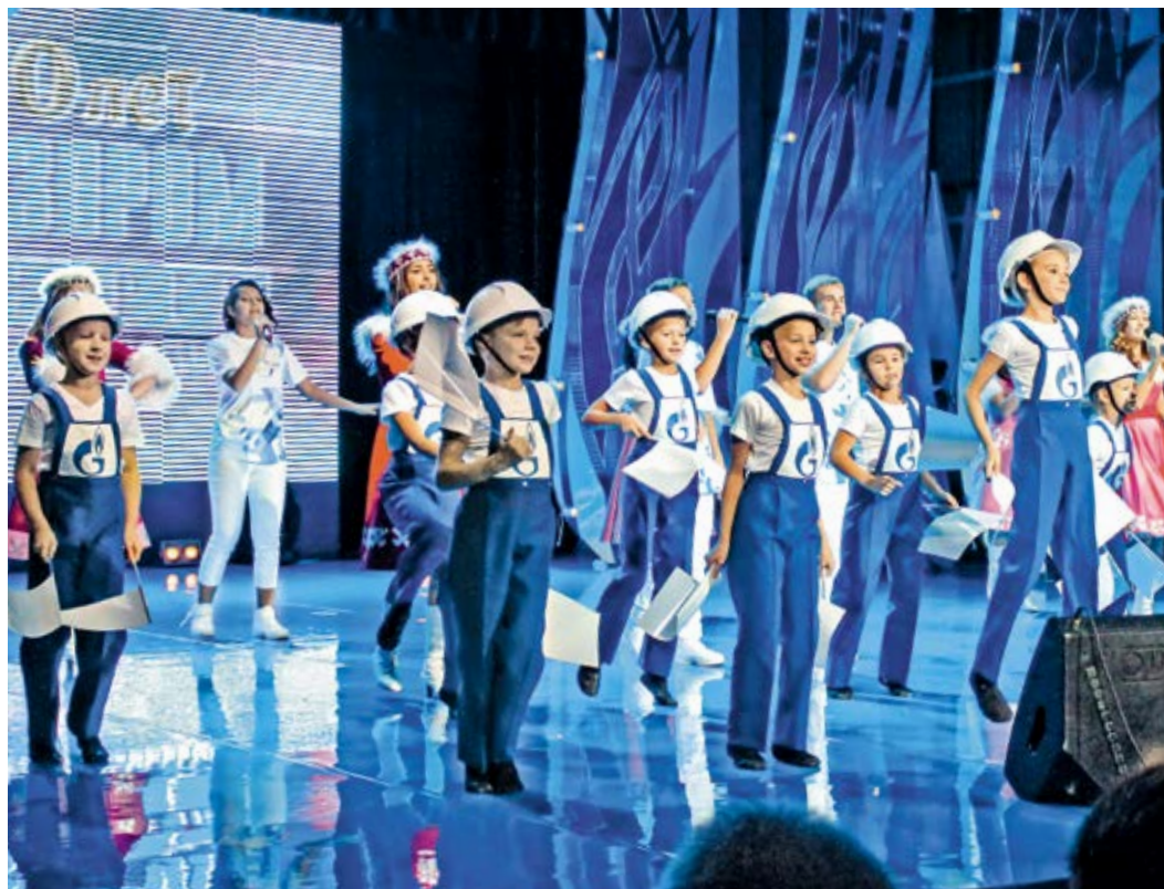
Праздничный концерт, подготовленный коллективами ДК «Юбилейный»