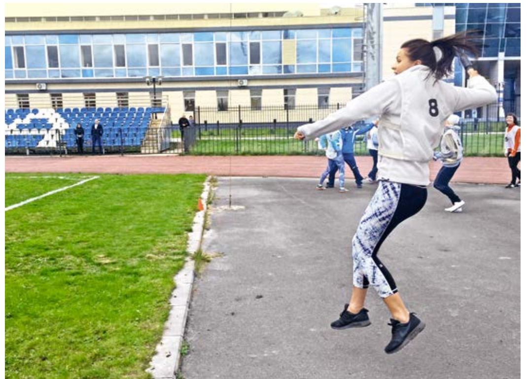
Одна из дисциплин сдачи норм ГТО — метание спортивного снаряда