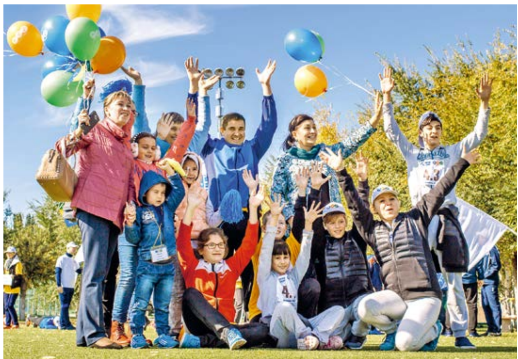
Новоуренгойцы: «От всей души благодарим общество «Газпром энерго» за этот незабываемый праздник спорта, семьи, добра, объединения и только положительных эмоций»

Нам пришлось долго ждать подсчёта результатов и начала церемонии закрытия турнира. Мы сидели все вместе на диванчике, отпускали разные шуточки и чувствовали себя единой командой. Я знала, что мы едем только за победой, а тут такое, и уже ребята подбадривали меня. Момент отчаяния,