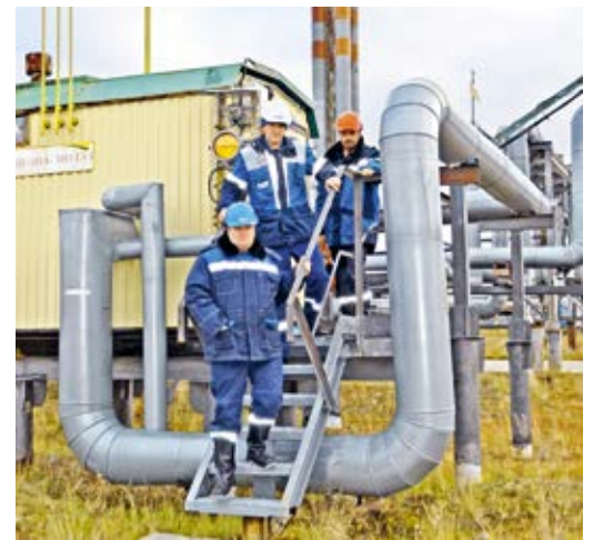
Бригада УГХ перекрыла подачу газа на котельную № 1

На этом аварийно-спасательная тренировка была завершена, персонал Уренгойского филиала ООО «Газпром энерго» не пострадал, оборудование ПАО «Газпром» не по-