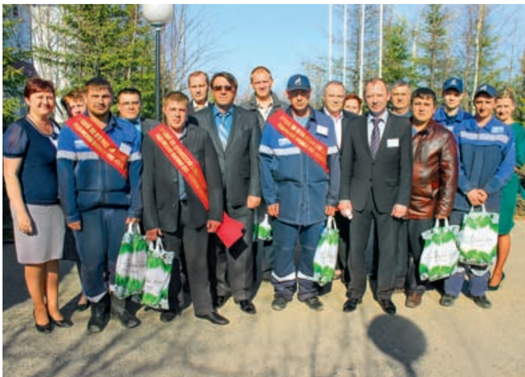
Общее фото участников конкурса и представителей конкурсной комиссии