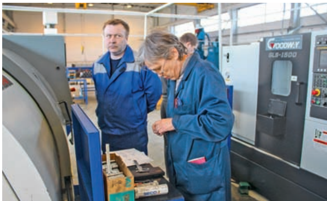
Специалист ОТК проводит выборочный контроль заготовок

ний. Общий контроль за соблюдением мер безопасности и охраной труда директор завода оставляет за собой.