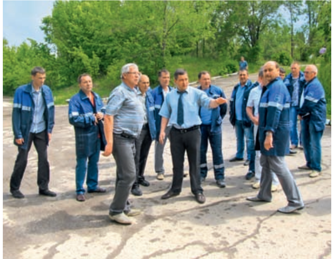
Разбор практической части с инструктором, «змейка» всех запутала

Во второй день состоялся конкурс по вождению на грузовом автомобиле, который проходил на учебном полигоне ФГБУ «ВНИИ охраны и экономики труда» Минтруда России. Программа конкурса включала