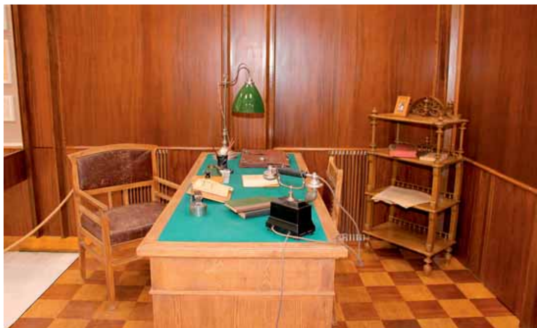
Фрагмент рабочего кабинета Ф.Э. Дзержинского в здании ВЧК на Лубянской площади, д. 2

А уж в каких условиях порой приходилось работать! К примеру, случай: для того чтобы запечатлеть на фотоплёнку момент шпионажа, просидел контрразведчик два дня «на задании» в мусорном баке, а когда вернулся домой с характерным запахом — супруга его домой не пустила, а отправила «туда, где прохлаждался двое суток», ведь жёнам не разрешалось разглашать свои действия.