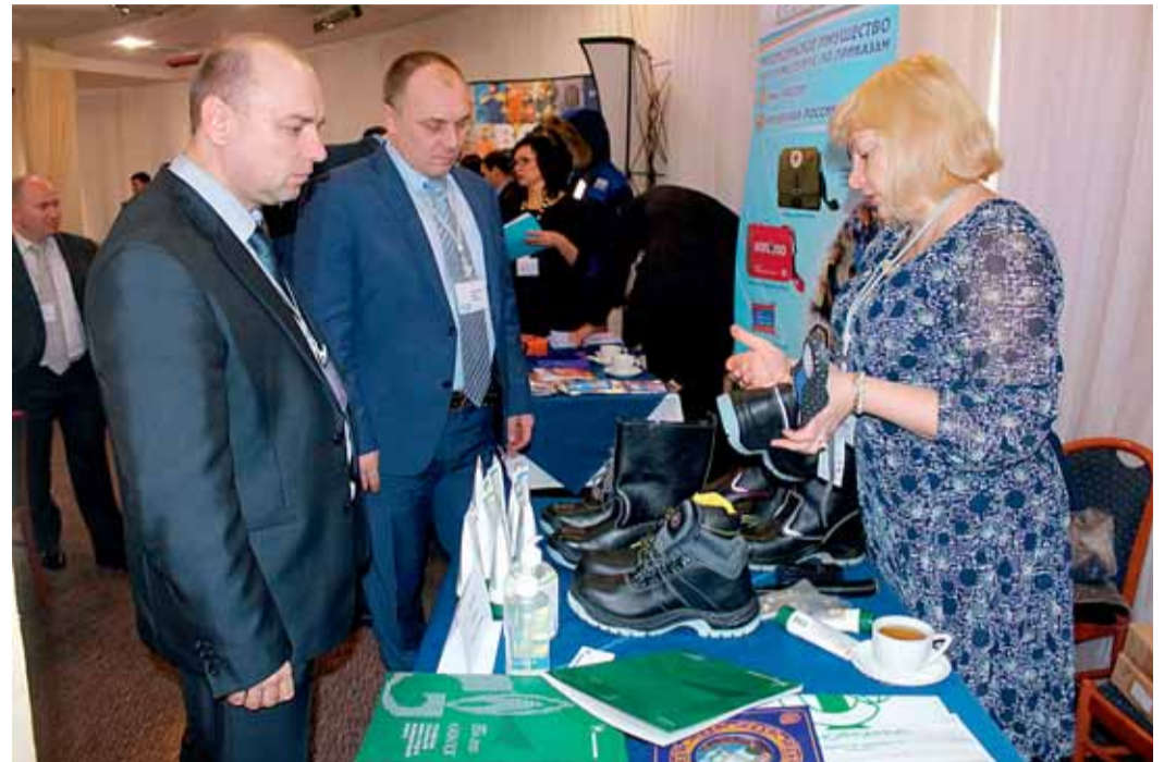
Участники знакомятся с выставкой средств индивидуальной защиты

ведена выставка средств индивидуальной защиты, представленная основными компаниями-производителями и поставщиками этой продукции. Вниманию участников совещания были представлены новые разработки спецодежды, спецобуви для защиты от агрессивных сред и пониженных температур, а также средств индивидуальной защиты, выполненных с использованием новейших материалов и технологий в основном отечественного производства. Компании представили образцы спецодежды, спецобуви, средств защиты рук, головы, глаз и лица, органов слуха и дыхания, дерматологические средства и средства для оказания первой помощи, а также блокирующие устройства для энергоустановок.