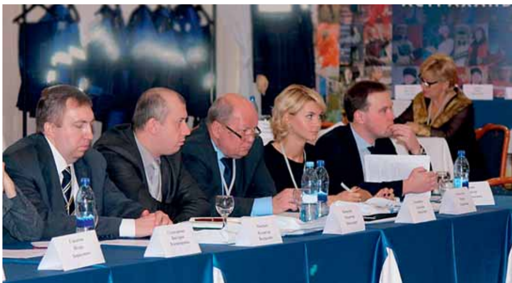
В зале заседания совещания

исшествий, внесены предложения по предупреждению подобных несчастных случаев в будущем. Также на совещании были заслушаны доклады представителей филиалов Общества по другим актуальным вопросам в продолжение основной темы совещания. Внимание