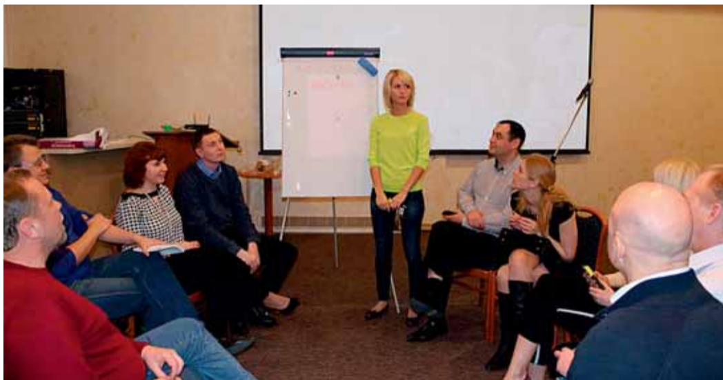
Дискуссии во время проведения деловой игры