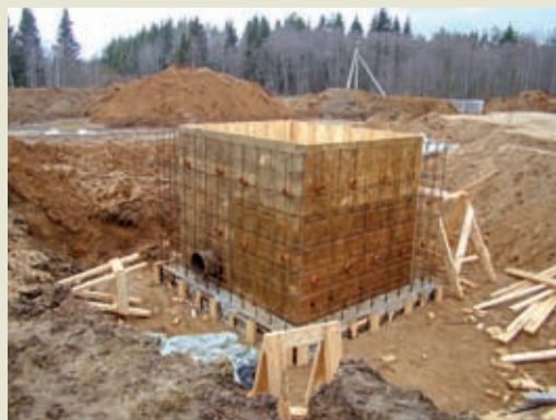
Участок строительства нового цеха ВОС расположен на левом крутом берегу реки Сухоны, на западной окраине села Нюксеница. Строящийся ВОС представляет собой здание рамно-каркасного типа высотой в коньке 11,780 м. Общая площадь застройки здания 425,75 м 2 .