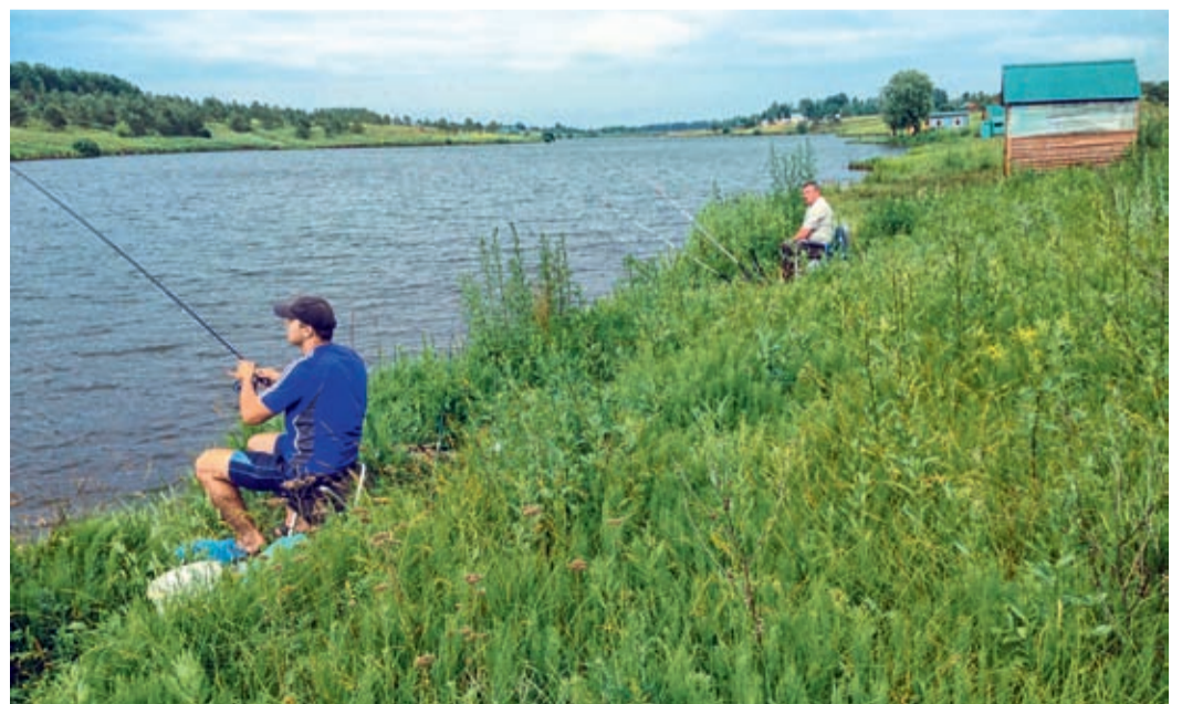
В ожидании крупного улова