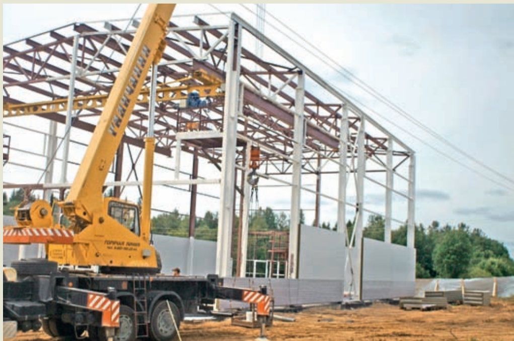
Первый этап — строительство здания водоочистных сооружений (ВОС) и устройство внутриплощадочных сетей. Осуществление пусконаладочных работ и ввод объекта в эксплуатацию. Второй этап — строительство резервуара чистой воды ёмкостью 500 м 3 с фильтром-поглоителем.