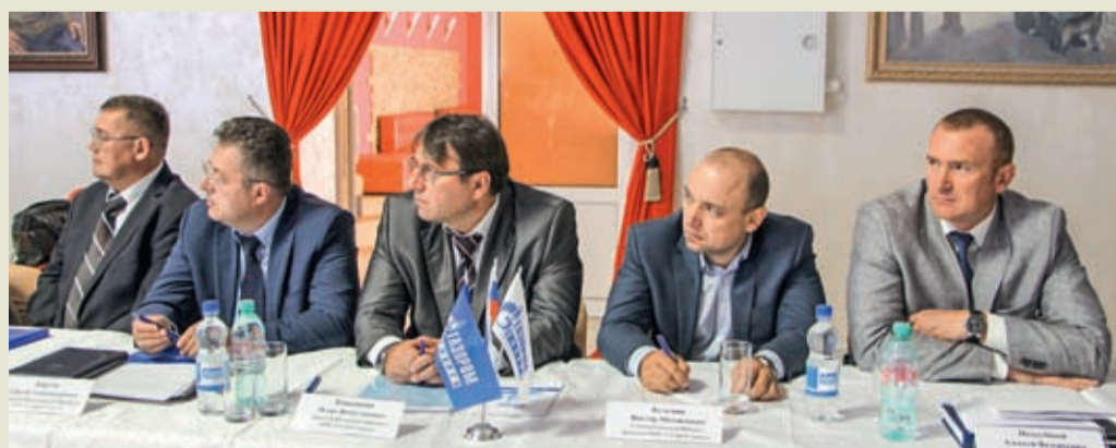
В ходе совещания