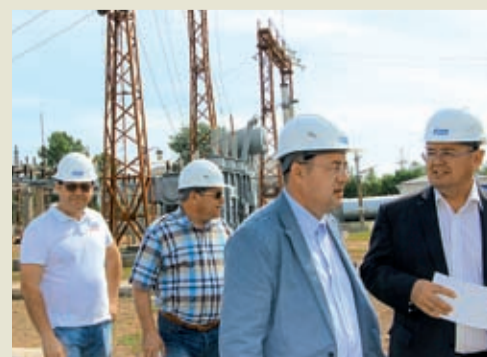
Участники совещания посетили производственную диспетчерскую службу, водозабор, котельную, понижающую подстанцию «ГПТ» 110/35/6