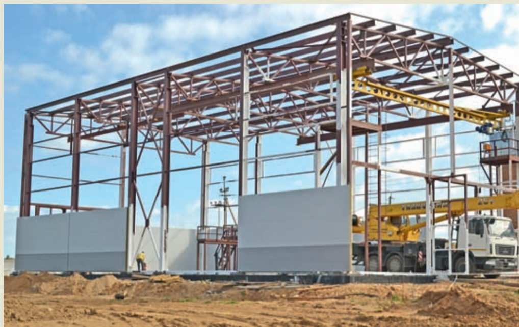
Максимальная расчётная суточная производительность строящейся станции ВОС составит 1445 м 3 /сут. Среднечасовая производительность в сутки максимального водопотребления — 60,5 м 3 /ч. Протяжённость инженерных сетей составит: водопроводных — 439,6 пог. м, водоотводящих — 183,0 пог. м, тепловых — 192,0 пог. м.