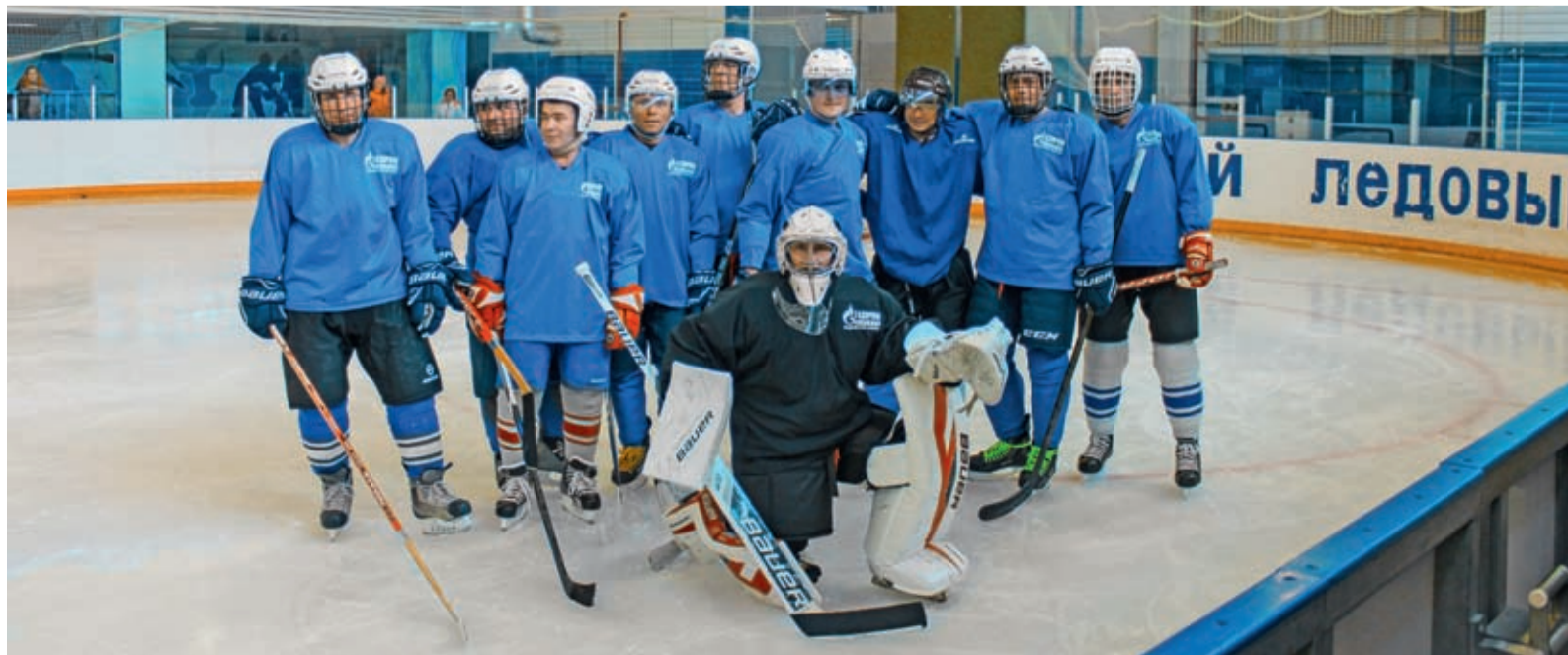
Хоккейная команда Надымского филиала ООО «Газпром энерго»