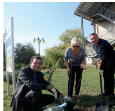
Благотворительная экологическая акция по посадке деревьев на Аллее добра