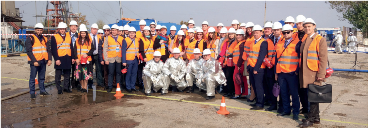
Наблюдение за учениями ООО «Газпром газобезопасность»

с именными табличками дочерних обществ – участников совещания. Новый зеленый участок назвали Аллеей добра.