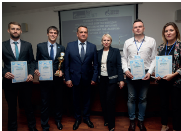
Победители Управленческих поединков

– Такой формат был предложен председателям Советов молодых ученых и специалистов в качестве